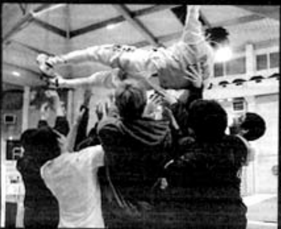
Les Américains fêtent la victoire de Bravo