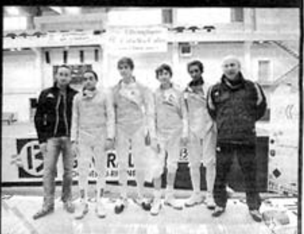
L'équipe de France victorieuse.